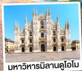
มหาวิหารมิลานดูโอโม