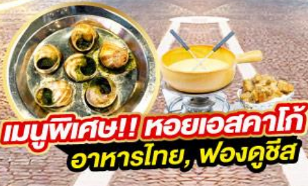
เมนูพิเศษ!! หอยเอสคาโก้ อาหารไทย, พวงดูซีส