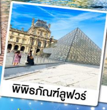
พีพีร์กัทลูฟวร์