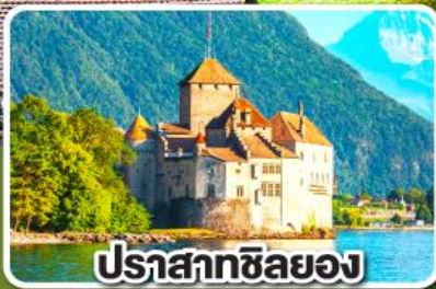
ปราสาทซิลยง