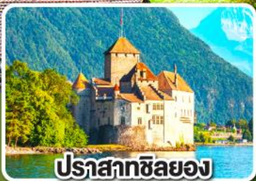
ปราสาทซิลยอง