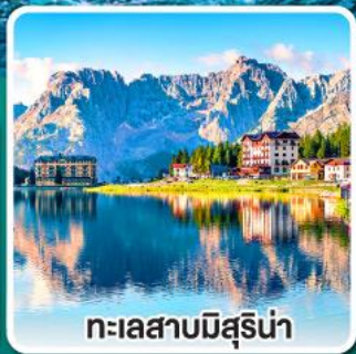
ทะเลสาบมิสุรีน่า

เข้าชมมหาวิหารเซนต์ปีเตอร์ ที่ใหญ่ที่สุดในโลกแห่งนครวาติกัน