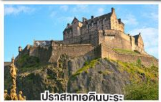
ปราสาทเอดิเนบะระ

เยือนสโตนเฮนจ์ และ พิพิธภัณฑน์โรมันโบราณ