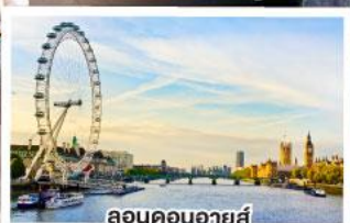
ลอนดอนอายส์

เยือนสโตนเฮนจ์ และ พิพิธภัณฑน์โรมันโบราณ