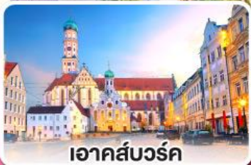
อาคส์บวร์ค