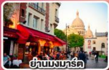
ย่านมงมาร์ต