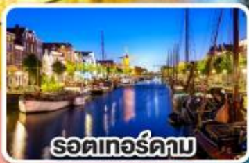
รอดเทอร์ดาม