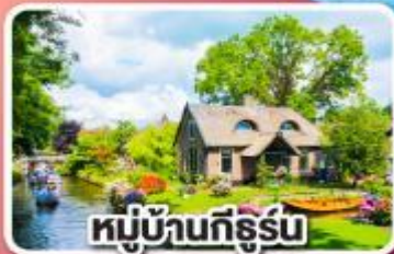
หมู่บ้านกีร์ฮูบ

พักปารีสและอัมสเตอร์ดัม อย่างละ 2 คืน ไม่ต้องเปลี่ยนโรงแรมบ่อย