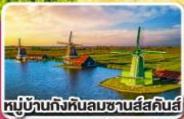
หมู่บ้านกังหันลมชาเนลส์คินส์