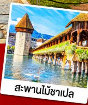
สะพานไม้ซาเปล

30 พ.ย.-08 ธ.ค., 08-16 ธ.ค.67 28 ธ.ค.-05 ม.ค., 11-19 ก.พ.68 08-16, 15-23 มี.ค.68 09-17 เม.ย.68