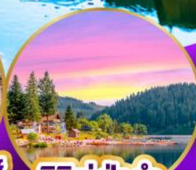
ททิเซ ปาด้า