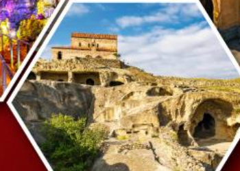
เมืองถ้ำอพิลิสต์ซิคเคห์