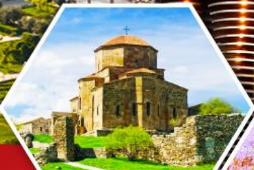
วิหารจอร์เจีย