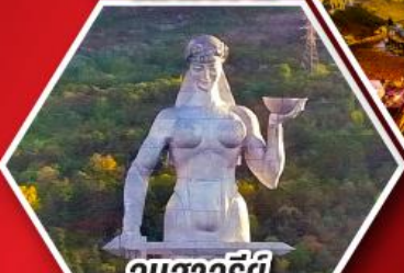
อนุสาวรีย์