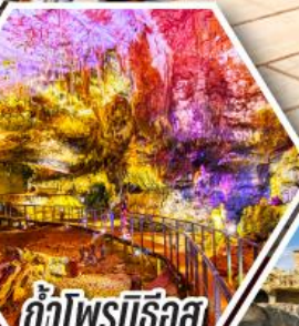
ลำไพลจอร์เจีย