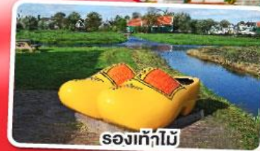
รองเท้าไม้