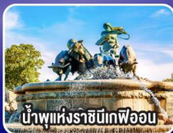
น้ำพุแห่งราชินีเทกฟออน