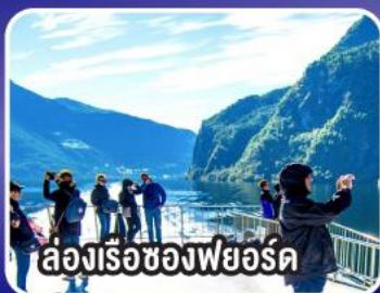
ล่องเรือของฟยอร์ด