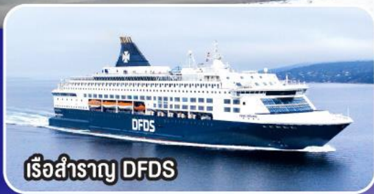
เรือสำราญ DFDS