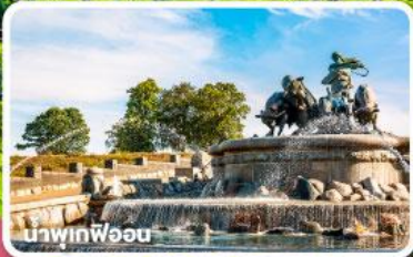
นาฟเทฟ็อน