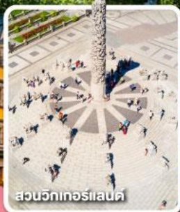
สวนวิกทอร์แลนด์