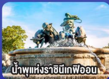
น้ำพุแห่งราชินีเดฟวอน