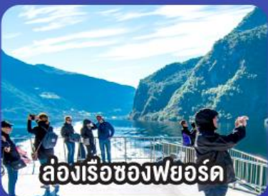
ล่องเรือช่องฟยอร์ด