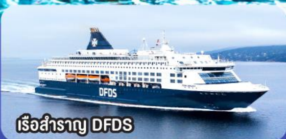
เรือสำราญ DFDS