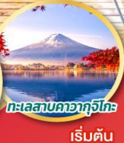
ทะเลสาบคาอากุจิโกะ เริ่มต้น

พักโรงแรมออนเซ็น 2 คืน พิเศษบุฟเฟ่ต์ขาปูยักษ์