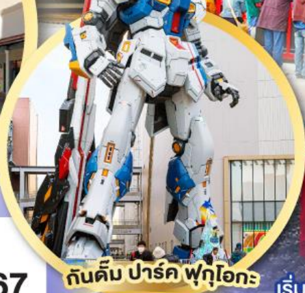
กันดั้ม ปาร์ค ฟุคุโอกะ