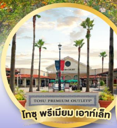
โทซู พรีเมียม เอาท์เล็ต