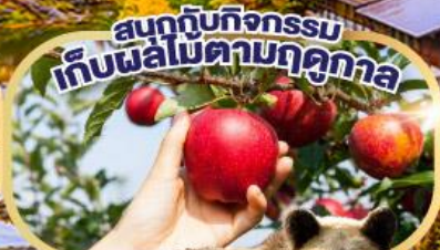
สนุกกับกิจกรรม เก็บผลไม้ตามฤดูกาล