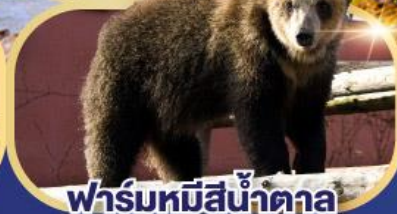
ฟาร์มหมีสึ่น้ำตาล

เที่ยวเต็มทุกวัน ไม่มีฟรีเดย์ ชมใบไม้เปลี่ยนสีหุบเขานรกจิโกกุคานิ