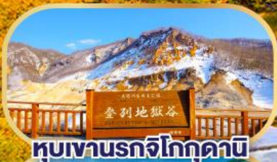
หุบเขานรกจิโกกุคานิ

นั่งกระเช้าชมวิวฮาโกดาเตะ (รวมค่ากระเช้า)