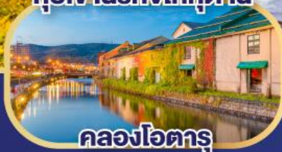
คลองโอดารุ