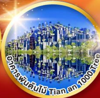
อุทยานพันต้นไม้ Tianan 1000 Tree