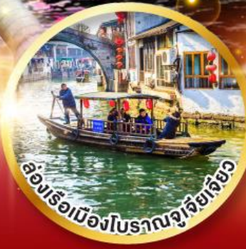
ล่องเรือเมืองโบราณซูโจวด้วยตัวเอง