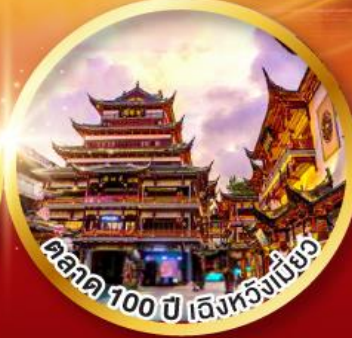
ศาลา 100 ปี เจิงหวงเฉียว