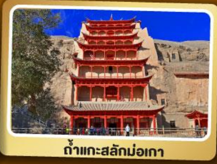
ถ้ำแกะสลักม่อเกา