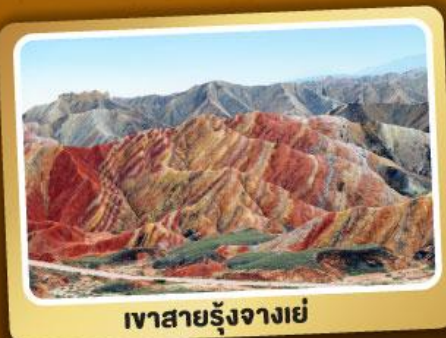
เวาสายรุ้งจางเย่