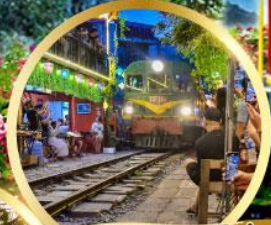
ร้านกาแฟรถไฟ