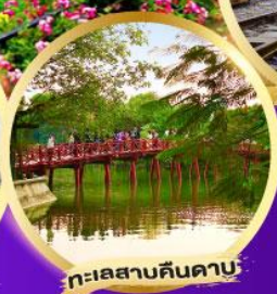
ทะเลสาบคิ่นดาบ