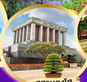
สุสานลู่ฮៃ