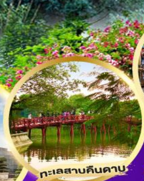
ทะเลสาบคินดาบ