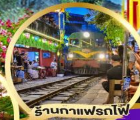
ร้านกาแฟรพี