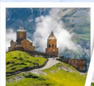
โบสถ์เกอร์เกติ