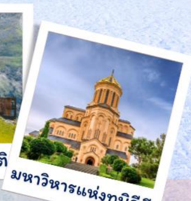
มหาวิหารแห่งทบิลีซี