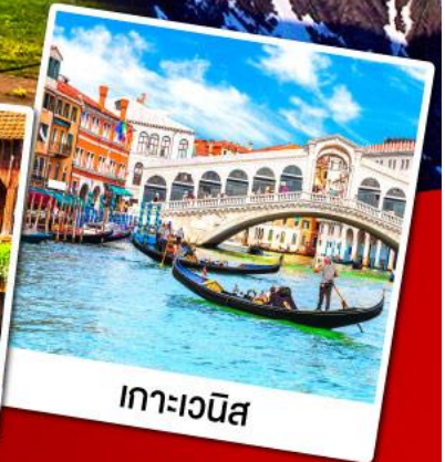
เกาะเวนิส