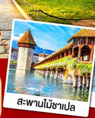
สะพานไม้ชาเปล