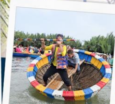
เรือกระด้ง