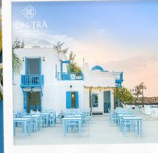
ซานตารีน่าคาเฟ่