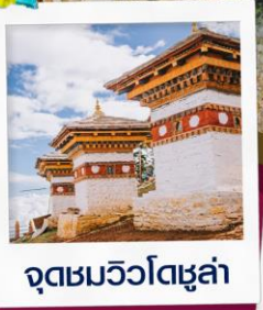
จุดชมวิวดาซูล่า