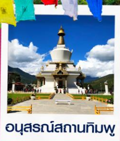
อนุสรณ์สถานทิมพู