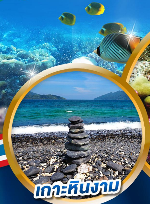
เกาะหินงาม