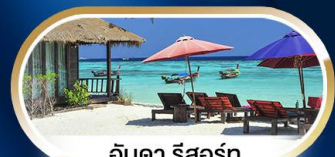
อินดา รีสอร์ท