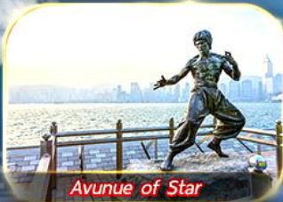
Avunue of Star