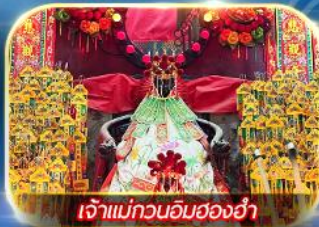
เจ้าแม่กวนอิมฮ่องฮำ