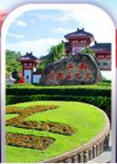
อุทยานหนานซาน

ทางเดินริมชายทะเลซานย่า - ทุ่งดอกกุหลาบอ่าวย่าหลอ อุทยานหนานซาน - เทียบบนเกาะดอกไม้ - ทุ่งกลีบบินปี ช้อปปิ้งในมาร์เก็ตถนนโบราณฉีไหว