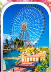
เมืองแฟนตาซี