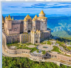
ปราสาทจันตรา