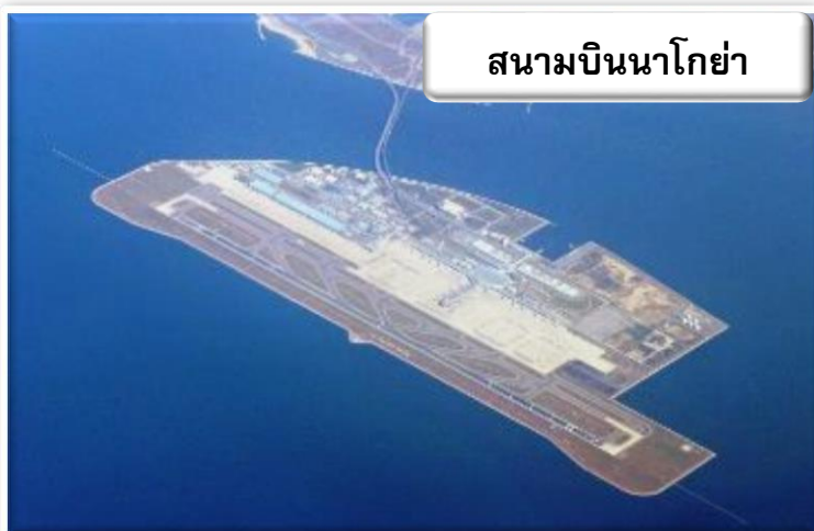
สนามบินนาโกย่า

บริการอาหารร้อนบนเครื่องพร้อมกับเมนูผลไม้สดเพื่อเติมเต็มความพิเศษไป