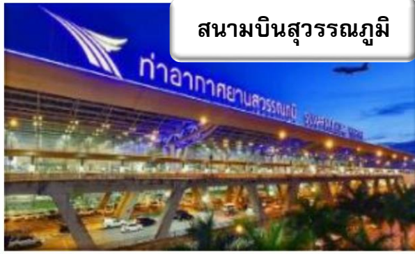
สนามบินสุวรรณภูมิ

เวลา 22.00 น. พร้อมกันที่ ท่าอากาศยานสุวรรณภูมิ อาคารผู้โดยสารขาออกระหว่างประเทศ เคาน์เตอร์ สายการบินไทย เจ้าหน้าที่คอยให้การต้อนรับ ดูแลด้านเอกสาร เช็คอิน และสัมภาระในการเดินทาง