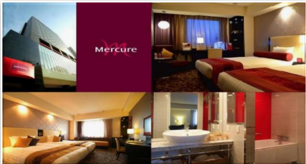
เก็งแองเจล - มิตรชนแองท์เล็ดพาร์ค

นำท่านเข้าสู่ที่พัก MERCURE SAPPORO HOTEL