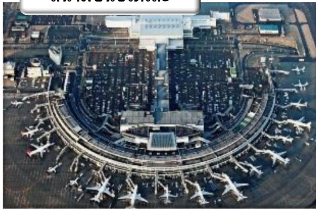
สนามบินซีโตเสะ

เวลา 23.50 น. ออกเดินทางสู่ สนามบินซีโตเสะ ประเทศญี่ปุ่น โดย สายการบินไทย เที่ยวบินที่ TG 670