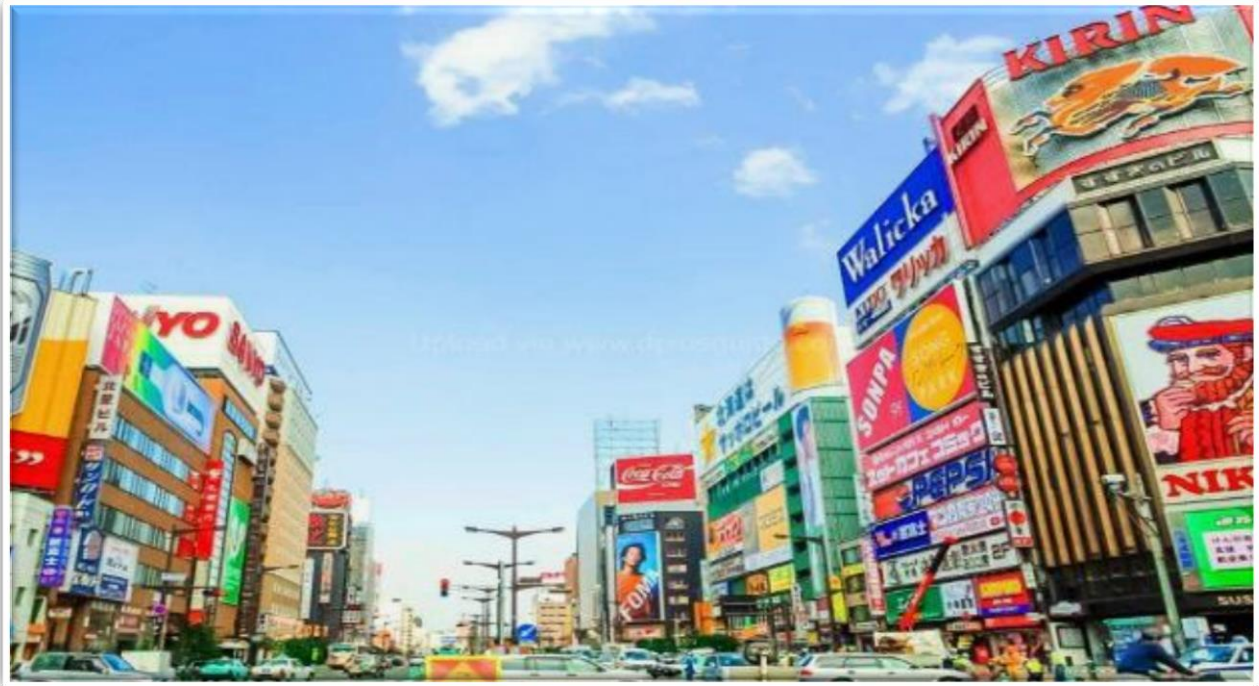
รับประทานอาหารค่ำ ณ ภัตตาคาร

จากนั้นนำท่านเดินทางสู่ ย่านซุซุกิโนะ(SUSUKINO) นับเป็นย่านที่เต็มไปด้วยแหล่งบันเทิงที่โด่งดังมากที่สุดของเมืองซัปโปโร(SAPPORO) อีกทั้งยังเรียกได้ว่าเป็นย่านบันเทิงที่ใหญ่ที่สุดในทางตอนเหนือของญี่ปุ่นเต็มไปด้วยร้านค้า บาร์ ร้านอาหาร ร้านคาราโอเกะ และตู้ปาจิงโกะ รวมกว่า 4,000 ร้าน