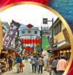
ย่านโบราณ ชิบูย่า