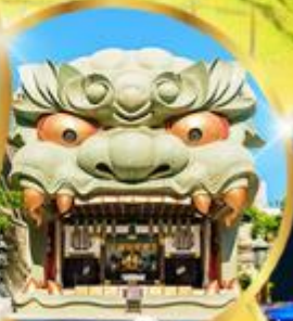
ศาลเจ้า นิมมะ ยาชากะ