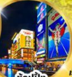
ช้อปปิ้ง ชินไซบาชิ