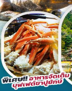
พิเศษ!! อาหารจัดเต็ม บุกเพ็ดซาบูยักซ์

เยี่ยมชมมรดกโลก ปราสาทคามาโมโตะ ชมความยิ่งใหญ่ของพระนอนทองสัมฤทธิ์ วัดนันโซอิน บอพร ศาลเจ้าดาไซฟูเก็มมังกุ เซ็คอินหมู่บ้านยูฟูอิน ทะเลสาบคินริน ชมวิว Daikanbo ซ้อปบั้ง Outlets