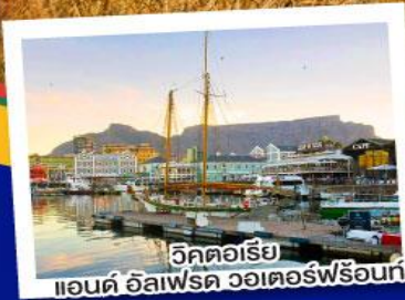
วิกตอเรีย แอนด์ อัลเฟรด วอเตอร์ฟร้อนท์