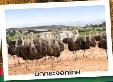
นกกระ-จอกเทศ