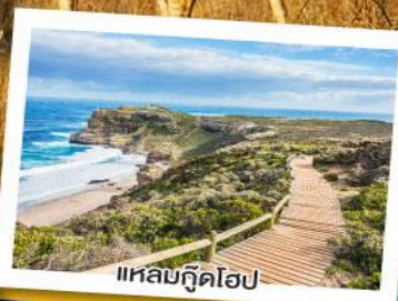
แหลมกู๊ดโฮป