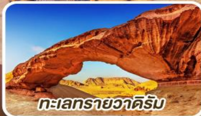
ทะเลทรายวาดีรัม