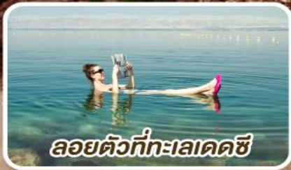
ลอยตัวที่ทะเลเดดซี