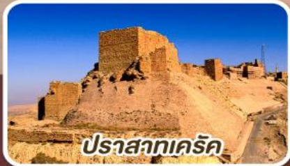
ปราสาทเคิร์ก