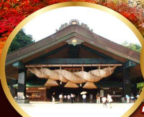
ศาลเจ้าอิชิโมะโกะ