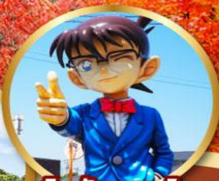
โคนันทาวน์