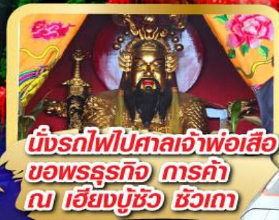
นั่งรถไฟไปศาลเจ้าพ่อเสือ ขอพรธุรกิจ การค้า ณ เขียงมูชีว ชิวเกา