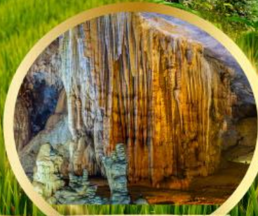
ถ้ำสวรรค์