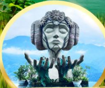
โมอาน่า ซาปา คาเฟ่