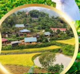
หมู่บ้านกัตกัต