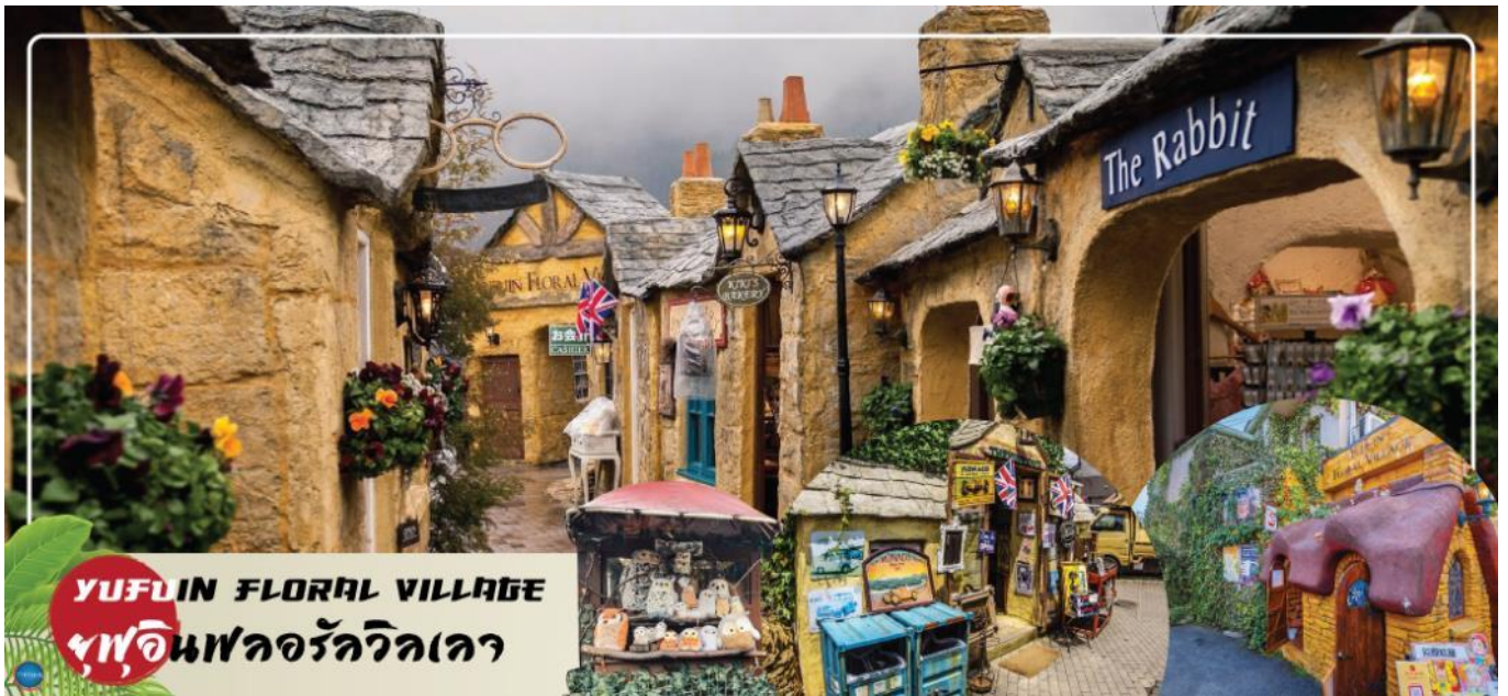
YUFUIN FLORAL VILLAGE ฟูอินฟลอรัลวิลเลจ