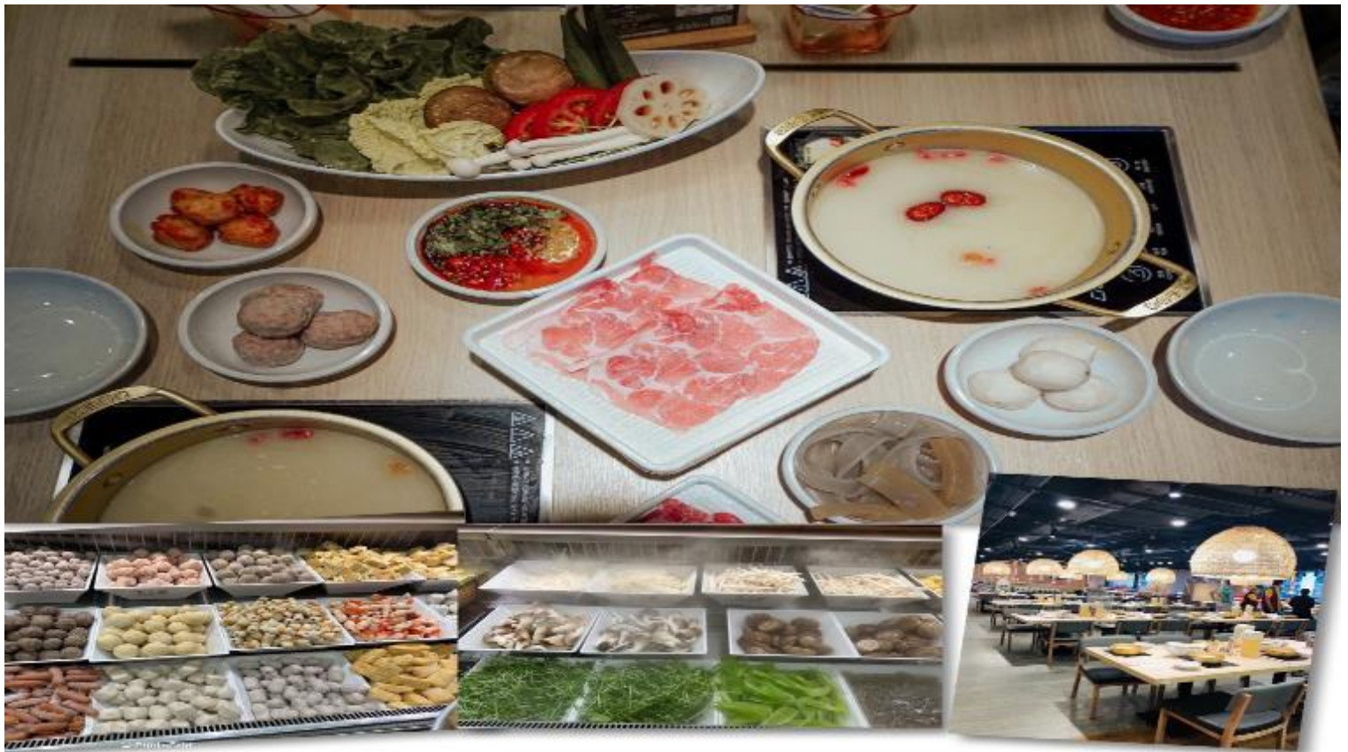
เที่ยง รับประทานอาหารเที่ยง 101 (3) เมนูชาบู