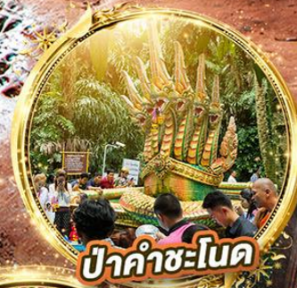
ป่าคำชะโนด