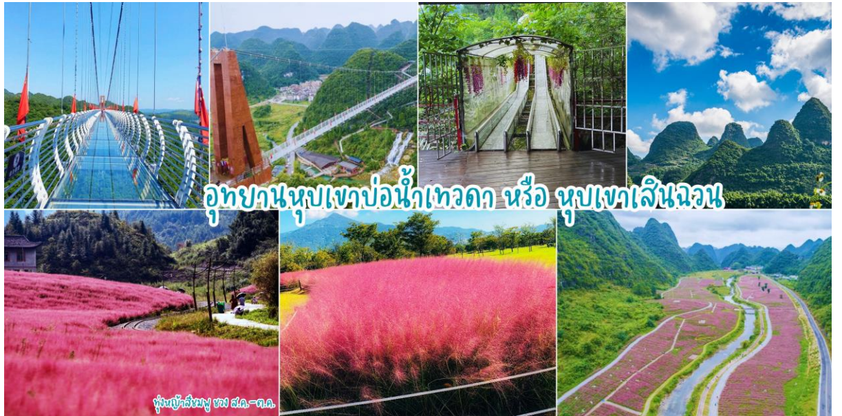
อุทยานหุบเขาบ่อน้ำเทวดา หรือ หุบเขาเสินฉวน

เช้า ๑๐|รับประทานอาหารเช้า ณ ห้องอาหารของโรงแรม หลังอาหารเช้าท่านเดินทาง อุทยานหุบเขาบ่อน้ำเทวดา หรือ หุบเขาเสินฉวน (ค่ารถแบตเตอรี่) มณฑลกุ้ยโจว เป็นแหล่งท่องเที่ยวที่คุณจะได้สัมผัส ดื่มด่ำกับธรรมชาติอย่างแท้จริง และสถานที่แห่งนั้นก็คือ “จุดชมวิวกุ้ยเขาเสินฉวน” เป็นสถานที่ท่องเที่ยวสุด UNSEEN ที่ชื่อเสียงของชาวจีน จุดชมวิวกุ้ยเขาเสินฉวน ตั้งอยู่ท่ามกลางธรรมชาติ ขุนเขา ป่าไม้ ธารน้ำและทุ่งดอกไม้ ที่อุดมสมบูรณ์สวยงาม ในเขตปกครองตนเองชนกลุ่มน้อยเผ่าเหมียวและปู้อี้ ฉีเยินหนาน อำเภอฉางชุ่น มณฑลกุ้ยโจวทางตะวันตกเฉียงใต้ของจีน ซึ่งเสน่ห์ที่ชวนดึงดูดให้นักท่องเที่ยวผู้ชื่นชอบธรรมชาติจากทั่วทุกสารทิศอยากจะมาเยือนที่จุดชมวิวกุ้ยเขาเสินฉวนแห่งนี้ นำท่านชมบ่อน้ำเทวดา ลักษณะเป็นบ่อน้ำพลูร้อนที่เกิดขึ้นตามธรรมชาติ เป็นสถานที่ที่ชาวกุ้ยโกวนิยมมาขอพรให้กิจการการงานราบรื่น จากนั้นนำท่านชมวิวกุ้ยเขาที่หยอด โดยสัมผัสความหวาดเสียว ณ สะพานกระจกหุบเขาน้ำพลูเทวดา (รวมค่าบัตรโดยสาร 1เที่ยว) สะพานแก้วมีความยาว 324 เมตร สูง 188 เมตร ให้ท่านได้ชมวิวดงงามด้วยยอดเขาที่หนาแน่นและแปลกตาและภาพรวมที่สมบูรณ์แบบ รูปร่าง ได้รับการยกย่องจากผู้เชี่ยวชาญและนักท่องเที่ยวมากมายว่าเป็น “สิ่งมหัศจรรย์ของโลก” นำท่านชมทุ่งดอกไม้ตามฤดูกาลที่มีความสวยงามแวะถ่ายรูปตามจุดชมวิวกุ้ยเขา (ในช่วงเดือน พ.ค.-ส.ค.67 ท่านจะได้ชมทุ่งทานตะวันหรือดอกไม้อื่นๆ // ในช่วงปลายส.ค.-ต.ค.67ท่านจะได้ชมทุ่งหญ้าสีชมพู)