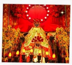
เจ้าแม่กวนอิมสองฮ่า