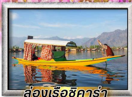
ล่องเรือชิคาร่า