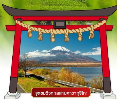
จุดชมวิวกะเลสาบคาวากุจิโกะ