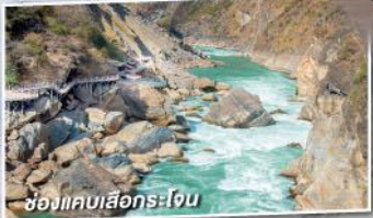
ช่องแคบเสือกระโจน