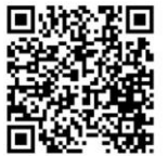
Photo Requirements for Chinese Visa Application