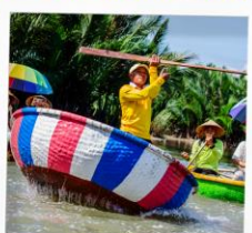
เรือกระดัง