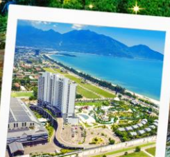
Mikazuki Japanese Resorts & Spa